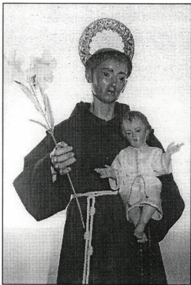
SAN ANTONIO DE PADUA